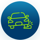
Baches en la vía