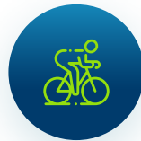
Ciclistas en la vía