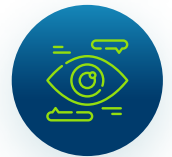
Zonas de baja visibilidad