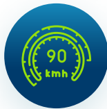
Límites de Vel. según vía transitada