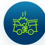
Zonas de alta accidentalidad